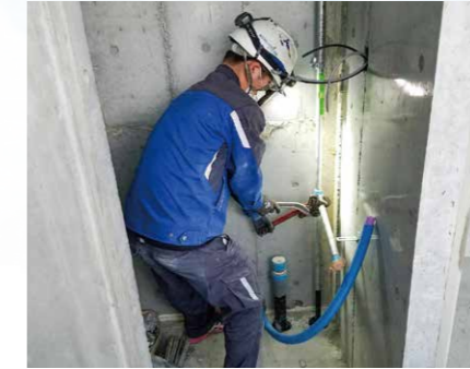
配管作業をしています。