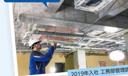
2019年入社 工務部管理課