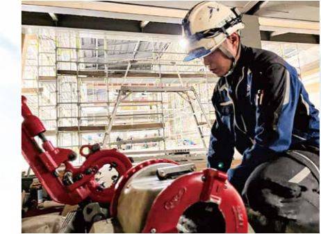
配管を加工しています。