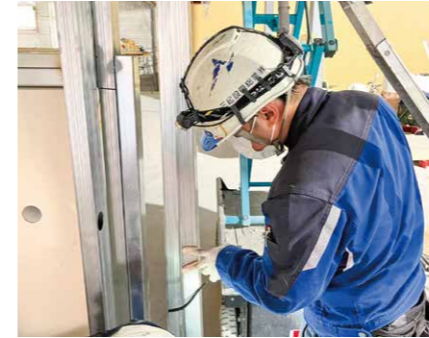
建築中の建物内で作業をしています。